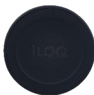
Figuur 1 - iLOQ cilinderkop

Deze sloten zijn te bedienen middels een mobiele telefoon met NFC.