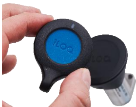
Figuur 3 - Keyfob bluetooth

Voor zeer uitzonderlijke toepassingen zijn er ook Bluetooth (oud) en NFC (nieuw) "keyfob's". Dat is een sleutelhanger waarmee het slot te bedienen is: