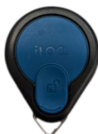
Figuur 4 - Keyfob NFC

Voor de telefoon ontvang je een SMS bericht wanneer er een sleutel voor je is aangemaakt, dat kun je herkennen aan een SMS die afkomstig is van "iLOQ", je krijgt dan een bericht dat deels lijkt op